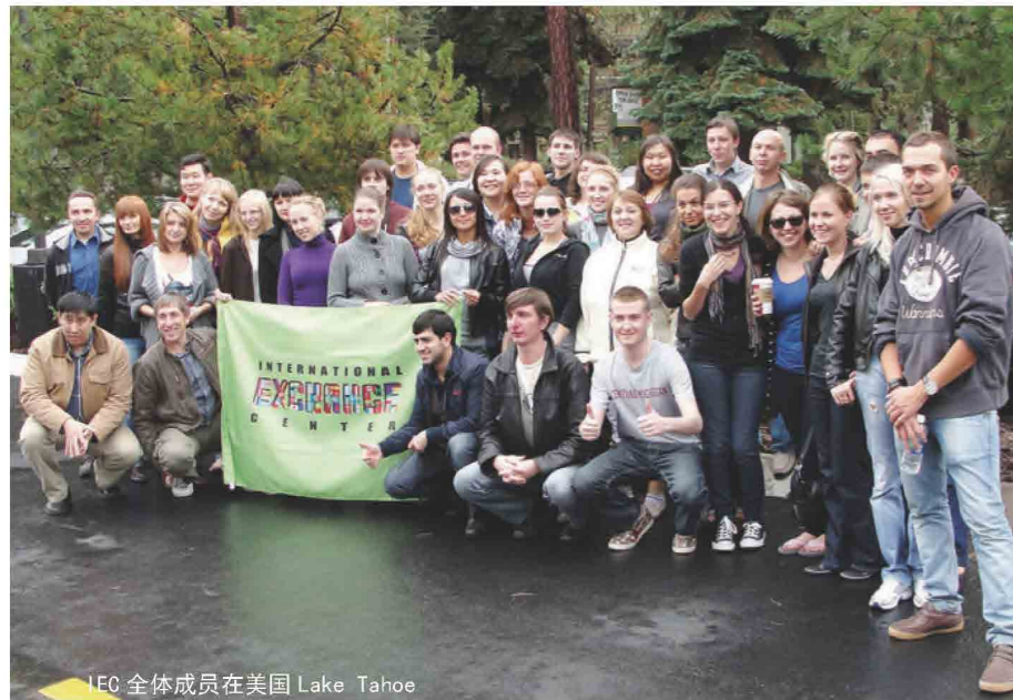
IEC 全体成员在美国 Lake Tahoe